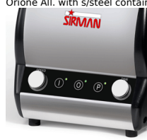
Orione Timer VV