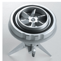
Metal gears on request