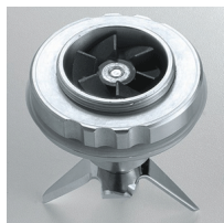
Vulcanized rubber gears