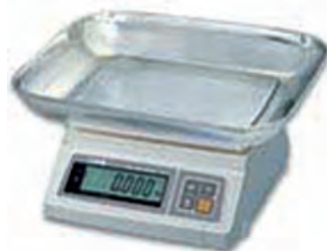
серия SW с платформой «чаша»