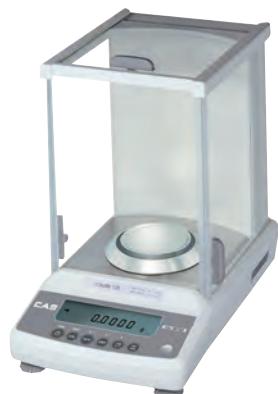
серия CAUW CAUX CAUY