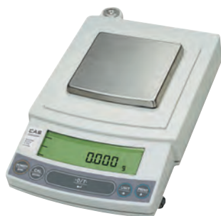
серия CUX / CUW