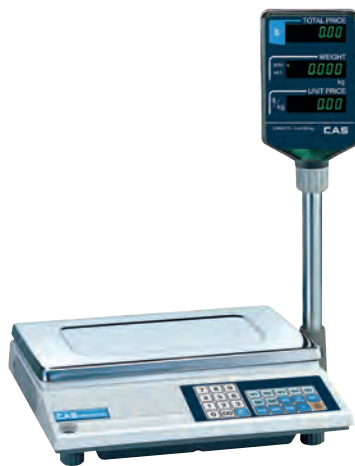
серия AP-M и AP-EX