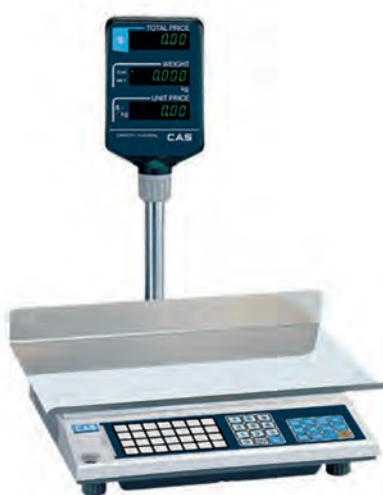
серия AP-M (BT) и AP-EX (BT)