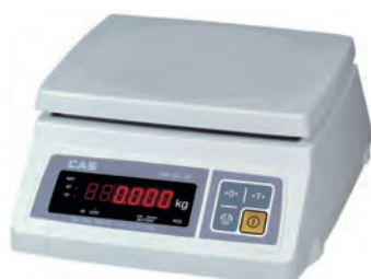
серия SW SW-ЖК