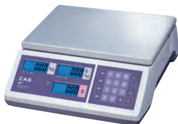
серия ER Junior CB