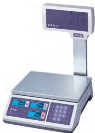
серия ER Junior CBU