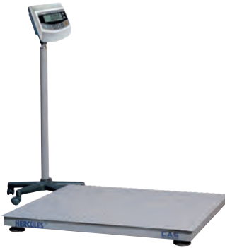
серия HERCULES HFS