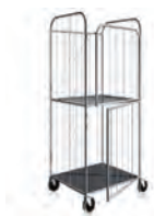
ТП 21.2 ТБ 12.2