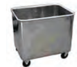
ТП 26.1 ТП 26.3